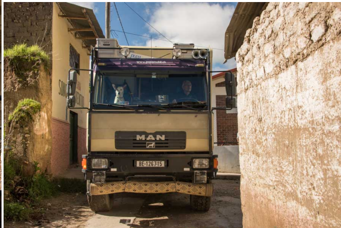
Rückspiegel einklappen und es passt!