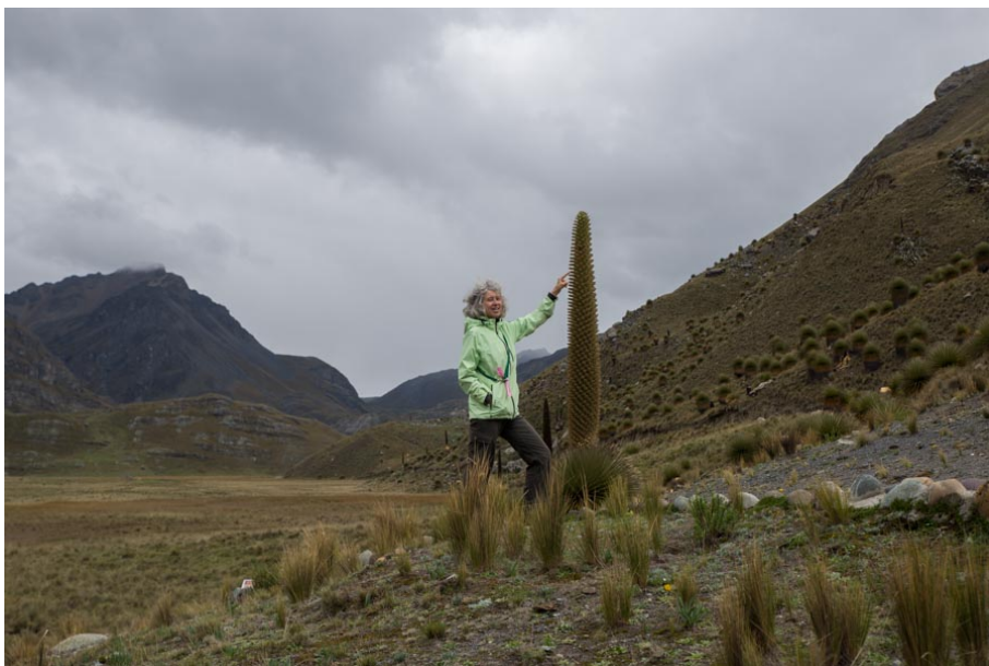
in diesem Park gibt es viele dieser ganz speziellen kleinen Pflanzen