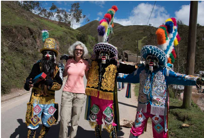
unterwegs in einem kleinen Dorf

Belohnt wurden wir aber mit einer grandiosen Landschaft und vielen netten überaus freundlichen Peruanern.