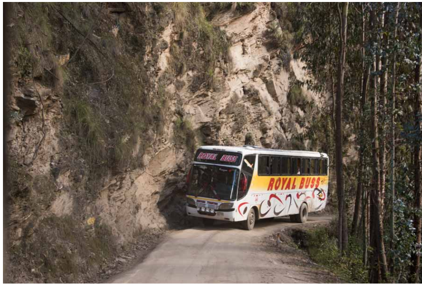
Auch für ihn wird es knapp