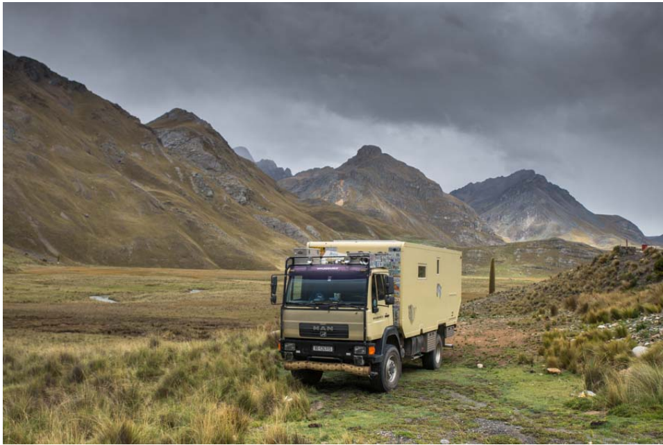
unser Platz für die zwei Neujahrstage auf 4200 Meter

Den finden wir auch in Nationalpark Huascarán in einer tollen Umgebung und auch das Wetter spielt für einmal mit. Wir sind schon zufrieden, wenn es nur stark bewölkt ist!