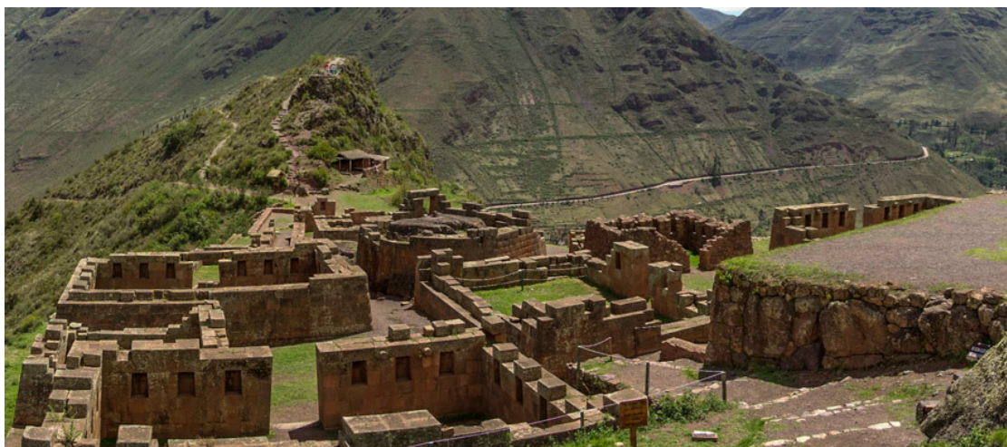
Pisac, fast wie Machu Picchu

Normalerweise ist dies ja kein Problem, aber hier sind wir auf 3400 Meter Höhe auf einer schmalen Bergstrasse die ohne Wendeplatz vor dem Ruineneingang endet. Links und rechts der Strasse parkierte Busse und in der Mitte gerade genügend Platz um durchzufahren. Die Ruinen mit ca. 1500 Personen überschwemmt.