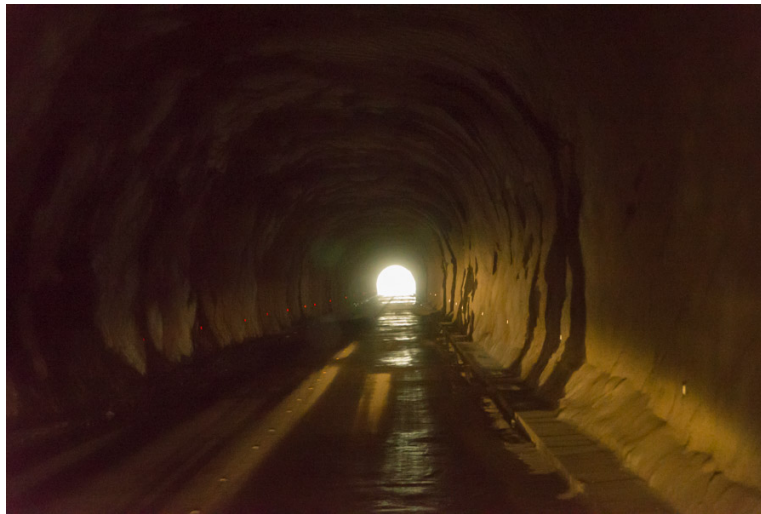
schön breiter Tunnel auf über 4100 Meter

140 km geteerte Strecke mit einem Pass auf 4176 Meter und, mit einem Tunnel, 400 Meter lang und schön breit, für Peru eine richtige Sensation.