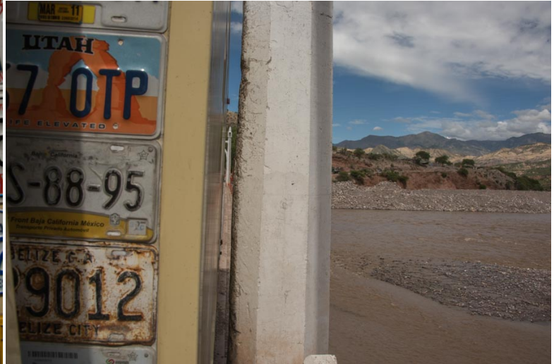
links sind doch auch noch 2-3 cm

jetzt nur keine seitliche Bewegung der Kabine, wie schon erwähnt, manchmal wären wir froh die Kabine wäre nur 2,3 und nicht 2,5 Meter