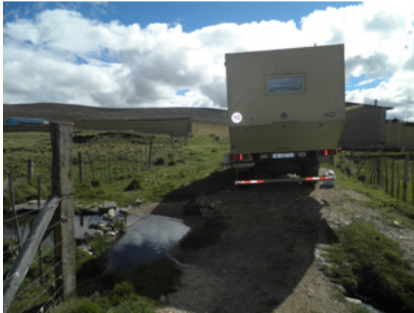
Pumpe in die Pfütze