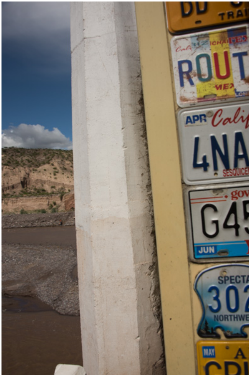
rechts, passt doch