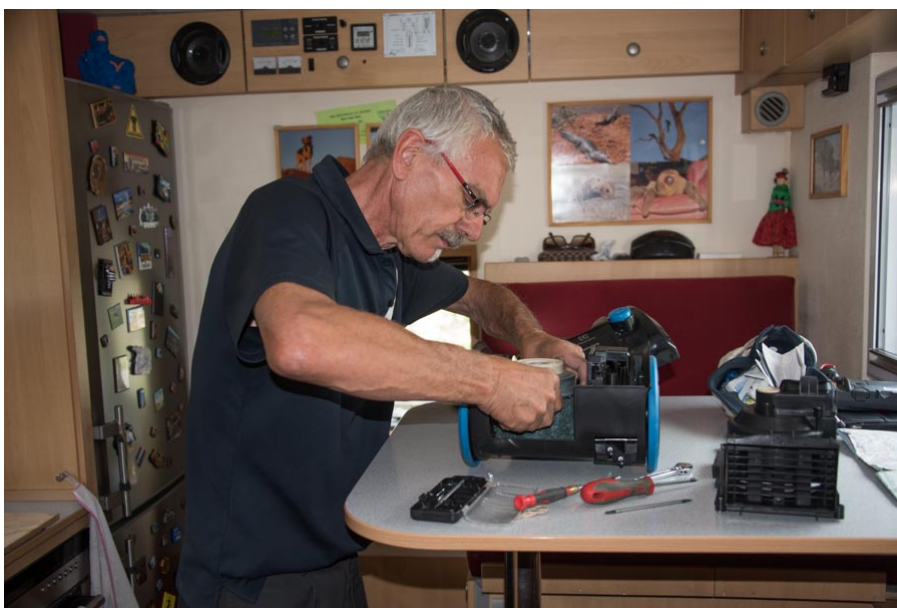
was geht hier nicht?

Ja schon wieder! Als ich vor einigen Tagen am staubsaugen war machte das Ding so komische Geräusche, also habe ich den Motor ausgebaut um einmal nachzusehen was da nicht kosher ist. Ein Problem mit den Kohlen und diese machten einen Kurzschluss dass die Fetzen flogen. Innert 10 Sekunden war die Kohle am Rotor durchgeschauert und ich und die nähere Umgebung schwarz vom abgewetzten Kohlestaub.