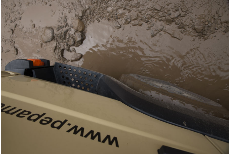
Matsch und Löcher

Die Ruinen sind eben Ruinen, alte Steine, mehr oder weniger gut aufeinandergeschichtet. Aber das Museum hier soll einsame Spitze sein. Und dies werden wir uns jetzt reinziehen.