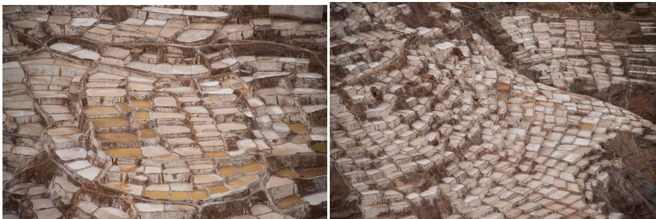
Salzgewinnung nur noch für die Touristen

Wir besichtigen auch noch die Salinas und füllen unseren Salzvorrat auf. Von den Inkas angelegt worden, dient die Anlage heute nur noch für uns Touristen.