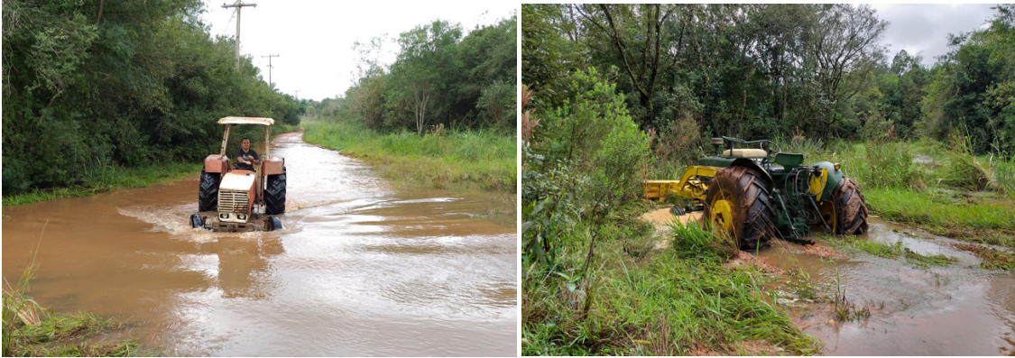
Berti auf dem Weg zu meiner Bergung Nummer 1

Nur kurz zu meiner Verteidigung. Jene die jetzt meinen, was kurvt der Typ da im Fluss herum? Der ist ja bescheuert, der muss ja absaufen. Es handelt sich hierbei um unsere ganz normale Strasse die sich bei Regen in einen Fluss verwandelt und bis anhin für einige Tage unbefahrbar war. Wie gesagt war, da nach meinem tollkühnen Einsatz heute das Wasser fast ganz abfließen kann und die Strasse dadurch befahrbar bleibt.