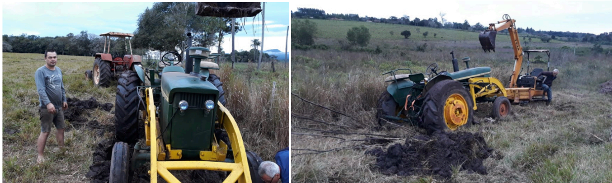
Bergung Nummer 2, wenigstens rentiert es sich jedesmal und Berti freut sich tierisch!

Nur kurz zu meiner Verteidigung. Jene die jetzt meinen, was kurvt der Typ da im Fluss herum? Der ist ja bescheuert, der muss ja absaufen. Es handelt sich hierbei um unsere ganz normale Strasse die sich bei Regen in einen Fluss verwandelt und bis anhin für einige Tage unbefahrbar war. Wie gesagt war, da nach meinem tollkühnen Einsatz heute das Wasser fast ganz abfließen kann und die Strasse dadurch befahrbar bleibt.