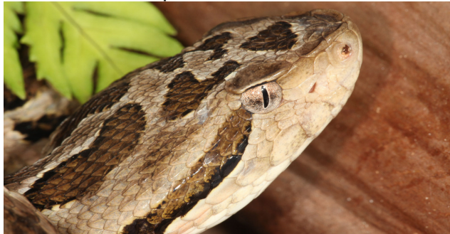
2. Vertikale Pupillen