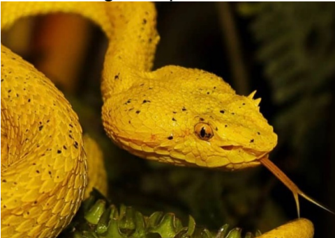
3. Dreieckiger Kopf