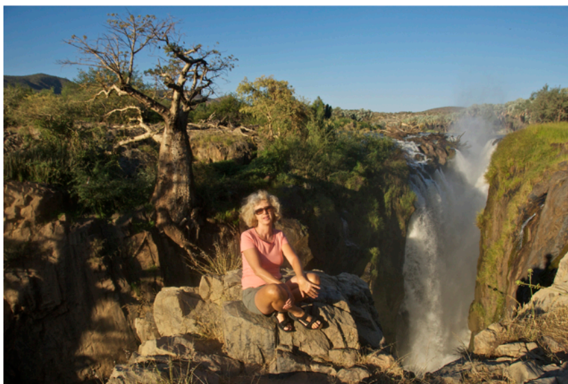
Epupa falls an der Grenze zu Angola

Epupa Falls besteht fast nur aus Hotels und Campingplätzen und wir können uns vorstellen, wie es hier währen der Saison zu und her geht.