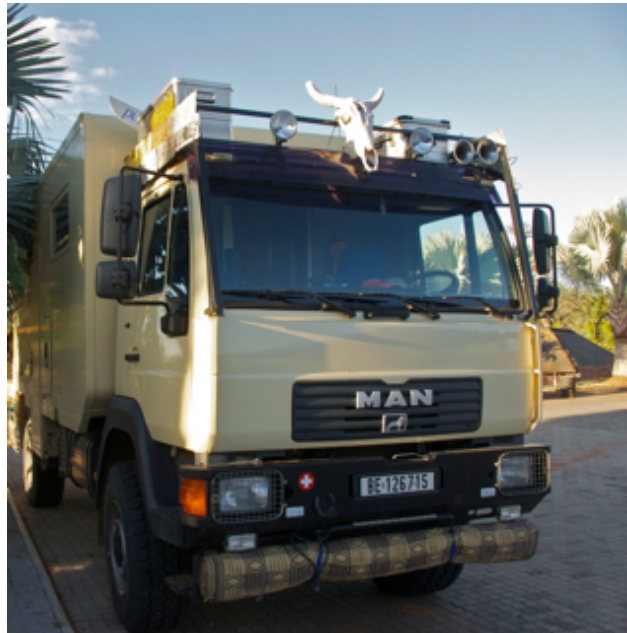
Mein schöner Kuhkopf

Bevor er endgültig zusammenklappt, schlage ich vor, den Kopf zu entfernen und im Stauraum zu deponieren. Aus den Augen aus dem Sinn. Afrikaner sind ja flexibel, so jedenfalls wurde es uns immer wieder erzählt.