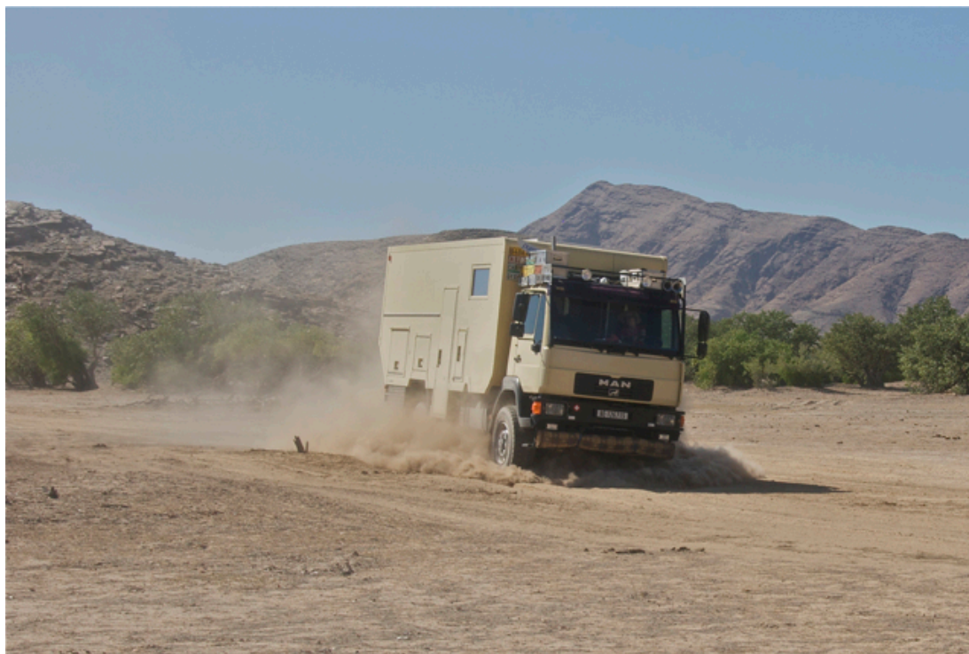
Renate in Aktion

50 Pula, dies ist die Landeswährung von Botswana, für das Auto, 130 Pula für den Park, für 2 Personen dies ist auch nicht übertrieben. Und, wir müssen mindestens einmal übernachten, dies kostet 100 USD für zwei. Na ja, für einen Parkplatz 100 USD ist doch ganz schön happig, aber wir sind ja nur einmal hier also los.