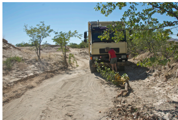
Alltag für uns, was nicht passt wird passend gemacht