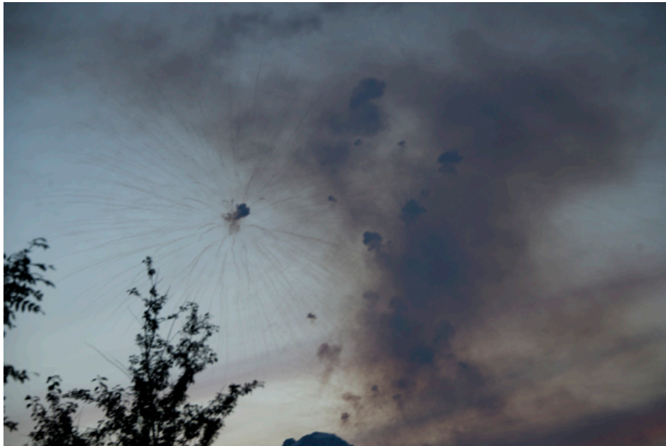
Knallen tut es auch bei Tageslicht

Aber dies stört hier niemanden, die sind es gewohnt, viel Rauch um nichts.